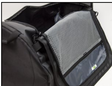
Stor nätficka under locket