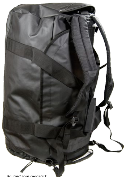
Använd som ryggsäck